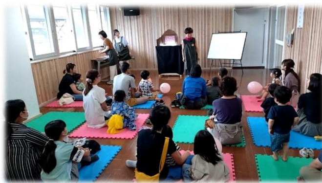
【図書館夏まつり・読み聞かせ】