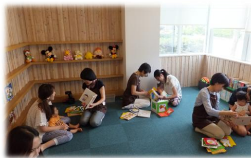
【図書館でのブックスタート】