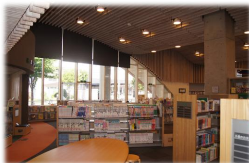
【図書館 児童書コーナー】