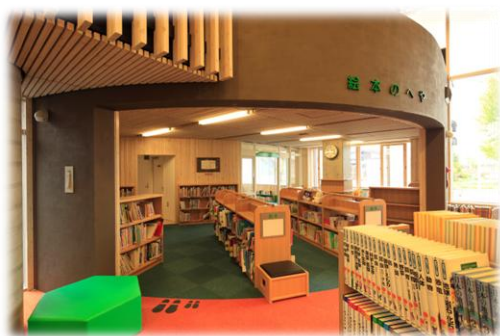
【図書館 絵本のへや】

また、図書館やなかよし児童館などで行われている、ボランティアによる読み聞かせやおはなし会は、子どもが読書に親しむ契機となっているため、これらの活動がより一層充実するよう支援し、以下の取組を推進します。