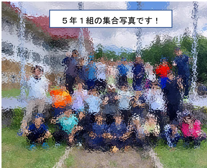
5年1組の集合写真です!