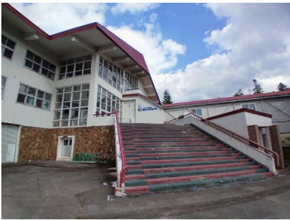
今回の宿泊研修で2日間お世話になった国立大雪青少年交流の家