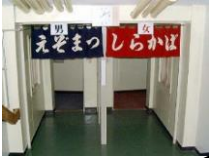
お風呂は、源泉掛け流しの温泉でした。