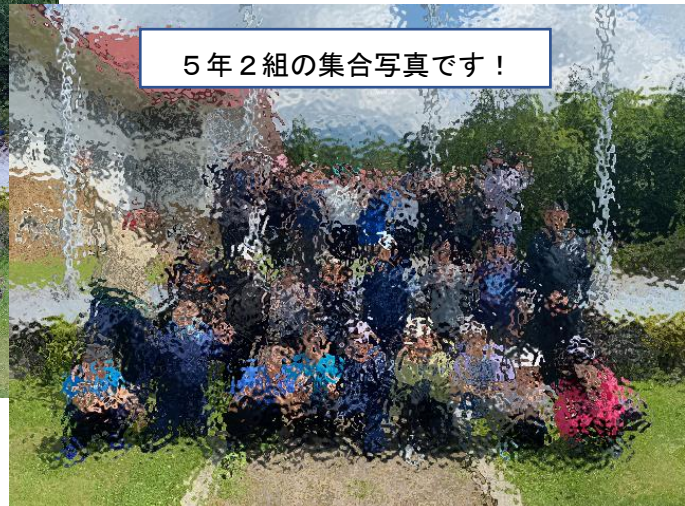
5年2組の集合写真です!