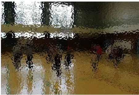
2年生の休み時間の交流の様子です。