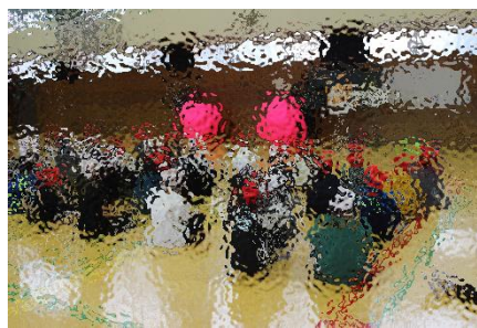
6年生の体育の様子です。