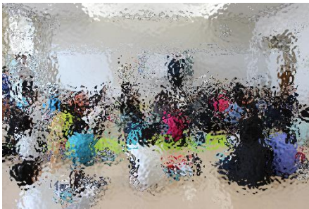
5年生の外国語の様子です。