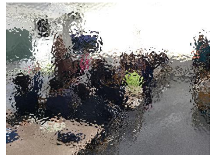
4年生の道徳の様子です。