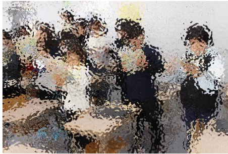
3年生の音楽の様子です。