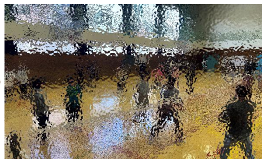
ミニバレーやドッジボールを親子で楽しんだ6学年のレクリエーションの様子