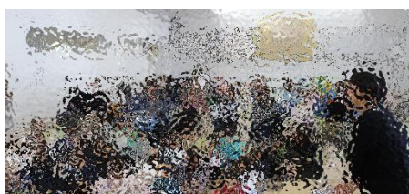
2年：生活「あしたへつなく自分たんけん」の授業の様子

令和6年度の最後の参観日を19日（水）低学年、20日（木）高学年で実施いたしました。何かとお忙しい中、多数のご家庭の皆様にご来校いただき、ありがとうございました。今回は、参観授業の後、2・5・6学年で、親子行事（レクリエーションなど）を開催していただきました。親子行事の企画運営でご尽力いただきました学級役員の皆様、そして今回の行事に参加・見学をくださったご家庭の皆様、この場をお借りして心よりお礼申し上げます。どの学年も、子供たちとご家庭の皆様が楽しそうに交流を図っているのが印象的でした。子供たちにとって、いい思い出がまた1つ増えたのではないかと考えております。本年度も残すところあと1か月となりました。職員一丸となり、子供たちのために教育活動の推進に努めてまいりますので、今まで同様のご支援とご協力をよろしくお願いいたします。