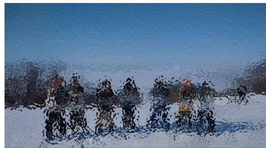
小学校生活最後のスキー授業を楽しんでいる6年生の子供たち