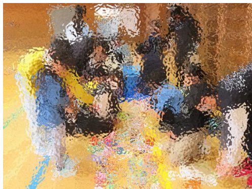
5学年児童の企画運営によるお店での交流や授業の体験をしている園児の皆さんの様子です。

青葉幼稚園、どんぐり保育園の（年長）園児との交流ですが、2学期から、1・2学年児童と行ってきました。そして、2月25日（火）には、今年度最後の交流となる幼稚園・保育園と5学年児童との交流を行いました。この交流を通して「4月から最上級生として学校生活に臨む心構えをもつ」ことを目的として、準備や企画、そして当日の進行などで一生懸命活動に取り組みました。図工の授業で作成したパズルや園児のために準備を進めてきたお店などで、終始和やかな雰囲気の中、交流を図ることができました。今回の交流を通じて、園児の皆さんが、4月からの本校での生活に大きな期待をもってくれたのではないかと思います。