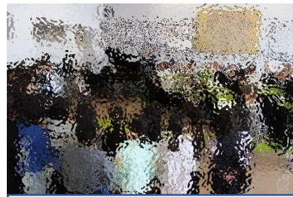
すずらん大学の皆様と3学年児童が心を一つに合唱しました。