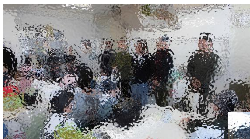
お米を提供くださったJAびえいの方々をお招きして実施した5年生の学年行事「親子でおにぎり作り」

令和6年度の最後の参観日を19日（水）低学年、20日（木）高学年で実施いたしました。何かとお忙しい中、多数のご家庭の皆様にご来校いただき、ありがとうございました。今回は、参観授業の後、2・5・6学年で、親子行事（レクリエーションなど）を開催していただきました。親子行事の企画運営でご尽力いただきました学級役員の皆様、そして今回の行事に参加・見学をくださったご家庭の皆様、この場をお借りして心よりお礼申し上げます。どの学年も、子供たちとご家庭の皆様が楽しそうに交流を図っているのが印象的でした。子供たちにとって、いい思い出がまた1つ増えたのではないかと考えております。本年度も残すところあと1か月となりました。職員一丸となり、子供たちのために教育活動の推進に努めてまいりますので、今まで同様のご支援とご協力をよろしくお願いいたします。