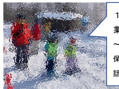
1年生のスキー授業の様子です。 ～リフト乗車などで保護者の皆様にお世話になりました。～