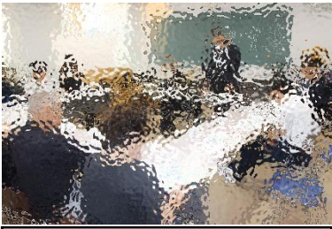
第1回学校運営協議会の様子

6月19日（木）に「第1回学校運営協議会」を開催しました。「学校運営協議会」は、保護者及び地域住民等が、学校の運営に積極的に参画することにより、学校と保護者、地域住民等が協働して特色ある学校づくりや学校を核としたコミュニティ活動の推進、信頼関係の深化などを目的に設置されています。その中で、「地域学校協働活動」をテーマに熟議を行いました。