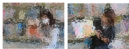
（上）今月の読み聞かせを担当した図書司書（左）と瀬戸教諭 （下）読み聞かせを真剣に聞いている児童の様子

5月16日（火）には、児童が色々な本に出会い、本に対する興味を高めることや、読み聞かせを通して、聞く力や言語力、想像力を育てることを目的として、読み聞かせ会を行いました。今後も、本校の図書司書と本校教諭の2名が読み聞かせを担当し、月に1度行っていく予定です。