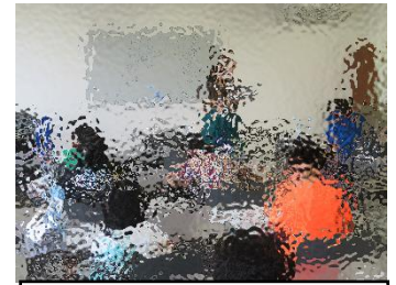
本校からも1名参加しました。

美瑛町教育委員会の主催で、「児童の基礎学力及び学習意欲の向上、学習習慣の意識付けを行う」という目的のもと、3~6年生を対象に「学習ルーム」を開設しています。この学習ルームは、夏休みと冬休みに各3日間実施され、教育支援員、外国語指導助手の皆さんが学習のサポートをしてくれます。他校の児童とともに学習を深めるいい機会となりますので、この場をお借りしてご紹介いたします。