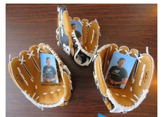
サイン入りのグローブと写真が本校にも届きました。

1月16日(火)から、3学期の学校生活がスタートしました。メジャーリーグで活躍されているドジャースの大谷翔平選手からプレゼント(3つのグローブ)が届きましたので、始業式で、全校児童に「野球しようぜ」でしめくられたメッセージと共に披露させていただきました。3学期の登校日数は、6年生が44日、1~5年生は48日です。この3学期は、1年で一番短い学期となりますが、以下に示したもののほかに、卒業式や同窓会入会式など、数多くの行事が予定されています。ご家庭の皆様には、今学期もお世話になりますが、本校の教育活動推進に今まで同様のご理解とご協力をよろしくお願いいたします。