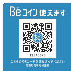
△ 店舗用 QR コード