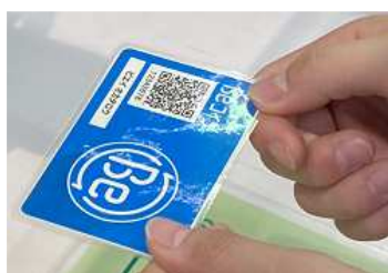
利用者カードのQRコードを端末機で読み取る

※ 貸与端末機をご利用の方は1)、2)まで完了していますので、登録内容に間違いがないかご確認ください。