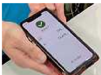
端末機に支払いポイントを入力する