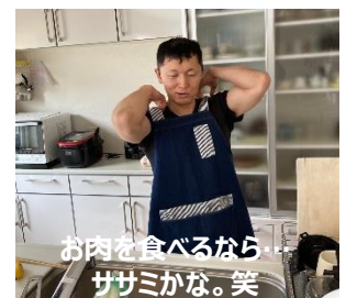
お肉を食べるならササミかな。笑