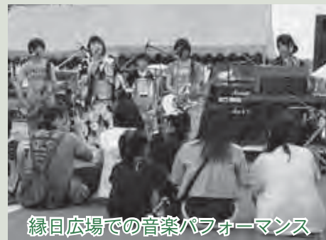
縁目広場での音楽パフォーマンス