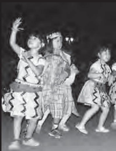
↑パフォーマンス審査。この日のために練習しました。

夜からは、仮装盆踊りが行われ、参加者たちは工夫を凝らしたユニークな衣装に身を包み、役場前でパフォーマンスを披露しました。パフォーマンス終了後は仮装行列が、沿道からの絶え間ない声援とフラッシュを浴びながら駅前までの道のりを行進。最後は美瑛の夜空を彩る大きな花火で締めくくりました。