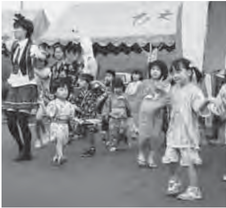
美沢行政区盆踊り大会

7月25日には美瑛神社祭が開催され、白金太鼓や神輿、浦安の舞い、獅子舞いが町内各所を回り、盛り上がりを見せ、最終地点の役場前では集まった大勢の観客からたくさんの拍手が送られました。最後を締めくくる「福の種まき」では集まった子どもたちが、まかれたお菓子里に一生懸命手を伸ばし受け取っていました。