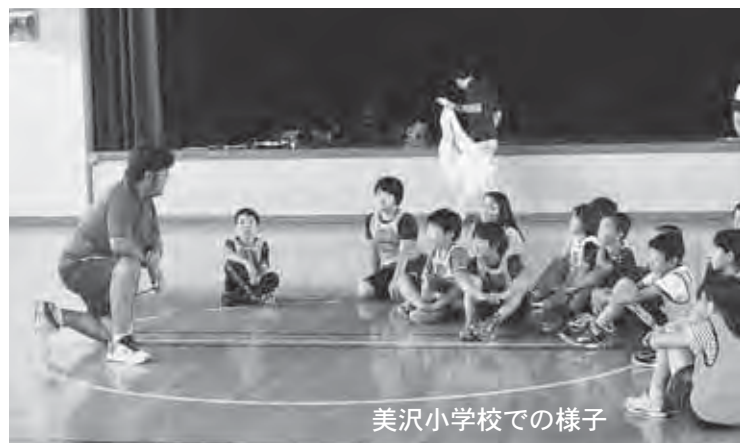
美沢小学校での様子

教室の授業では、夢先生の挫折と成功の経験談を聞き、「夢を持って努力すること」の大切さを学び、児童たちはそれぞれの持っている夢について発表を行いました。