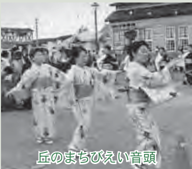
丘のまちびえい音頭