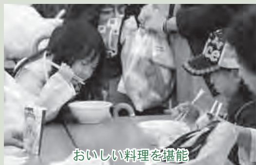
おいしい料理を堪能