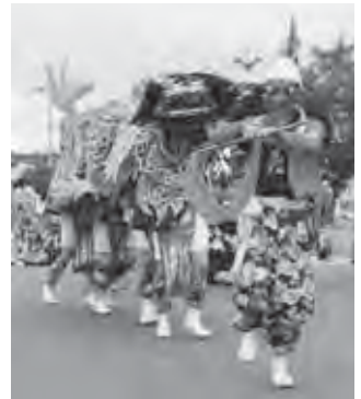
美瑛神社祭で迫力の獅子舞

そのほか、ほの香祭り、南町第3町内会と慈光園合同で行われた盆踊り大会などが開催され、皆さん美瑛の夏を存分に楽しんでいました。