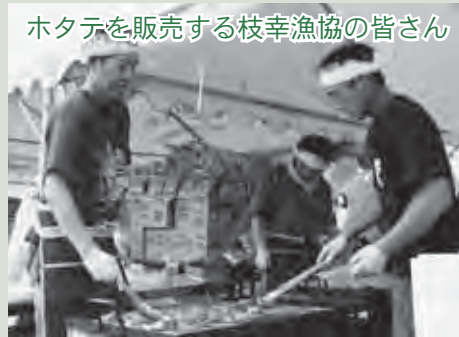
ホタテを販売する枝幸漁協の皆さん