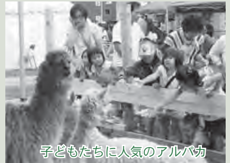
子どもたちに人気のアルパカ