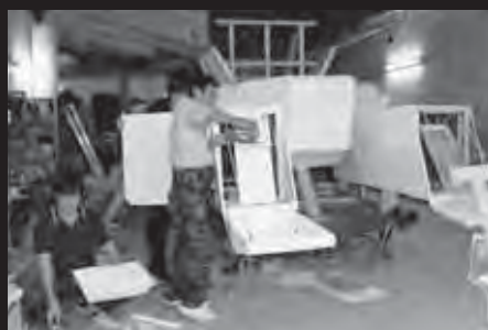
↑制作現場。事前の準備にも熱が入ります。