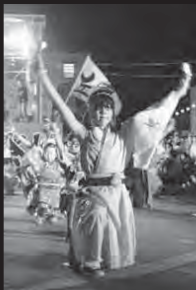
↑ よさこい同好会演舞