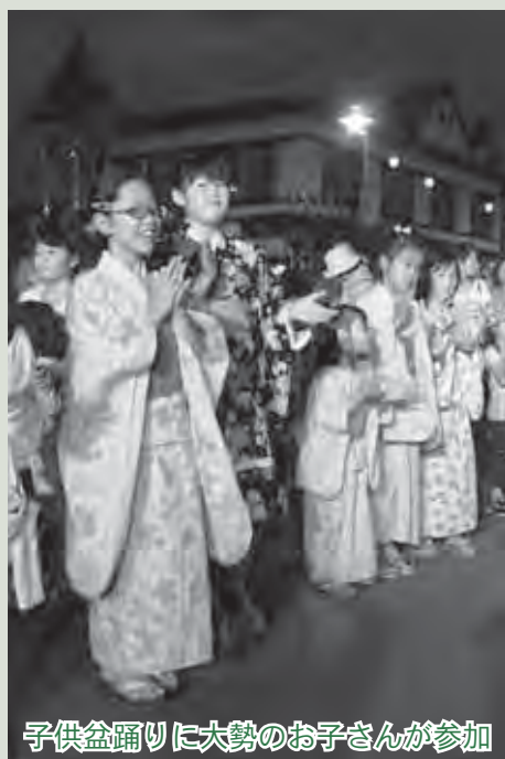
子供盆踊りに大勢のお子さんが参加