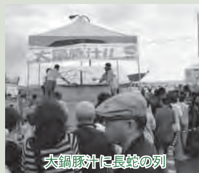
大銅豚汁に長蛇の列