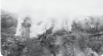
大正火口の噴煙（発光現象周辺）

火山活動は概ね静穏に経過しており、火口周辺に影響を及ぼす噴火の兆候は認められません。ここ数年、山体浅部の膨張や大正火口の噴煙量増加および地震活動が観測されています。また山麓の温泉成分にわずかな変化が認められているほか、大正火口付近が高感度カメラで明るく見える現象が観測されています。今後の火山活動の推移に注意してください。