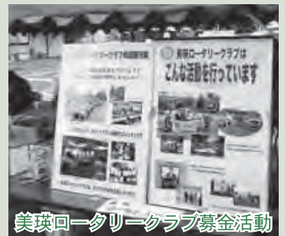
美瑛ロータリークラブ募金活動