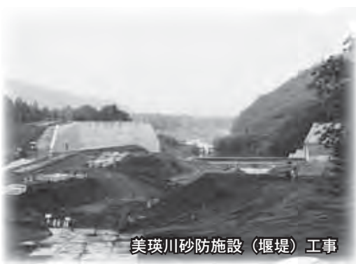
美瑛川砂防施設（堰堤）工事

気象台から説明があり、その後、場所を替え、美瑛川の大規模な工事現場を見学。参加者からは「これだけ大掛かりな工事が行われていることは全く知らなかった。存在を知ると安心です」の声。