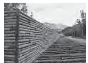
1 誘導（導流堤） 災害に繋がらないよう安全な方向へ誘導

「十勝岳火山砂防情報センター」には北海道開発局が各種機器を設置し、十勝岳の火山活動情報を集中管理しています。また札幌管区气象台では、火口周辺に観測機器を配置して24時間体制で十勝岳を監視しながら、定期的に現