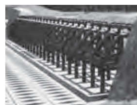
3 分ける（透過型えん堤） 災害につながる大きな岩や流木を捕まえる