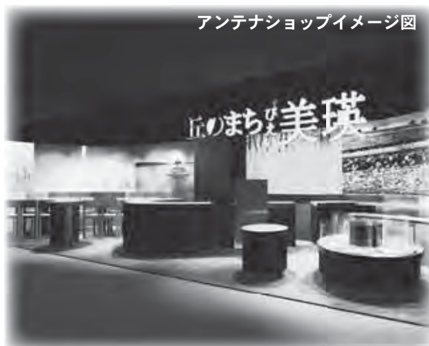
アンテナショップイメージ図