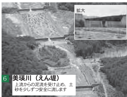
6 美瑛川（えん堤） 上流からの泥流を受け止め、土砂を少しずつ安全に流します

美瑛町では全戸に対し、美瑛町防災緊急避難図と洪水ハザードマップ、防災無線を配布しています。洪水ハザードマップには避難場所はもちろん、日頃からの備えや緊急連絡先などが掲載されています。今一度よく内容を確認し、災害が発生してからではなく発生する前に、自分たち一人一人に何ができるか考えてみましょう。