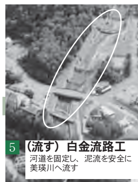
5 (流す) 白金流路工 河道を固定し、泥流を安全に美瑛川へ流す