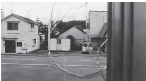
破損した美瑛小学校プール窓ガラス

また本通り沿いにある本町1丁目の公共駐車場を整備しました。商店街での買い物や食事などの際、自由に利用ください。