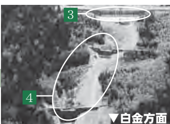
▼白金方面 3 の下流にある 4 の大きなえん堤