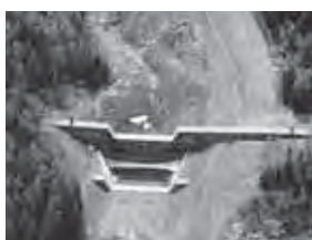
4 止める（えん堤） 上流からの土砂を堆積させ、流れの勢いを弱め、下流への流出調整をする